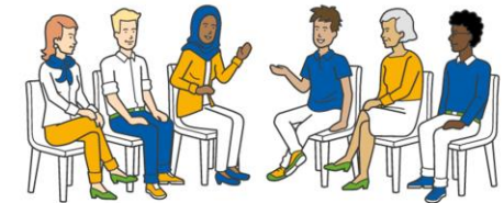
Grafik von simpleshow

Blaues Kreuz in der Evangelischen Kirche Landesverband NRW e.V. Mathiasstr. 13 | 44879 Bochum Tel.: 0234 490427 | E-Mail: info@bke-nrw.de | Web: www.bke-nrw.de